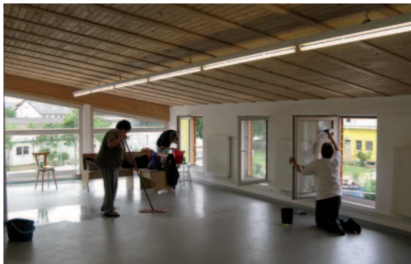
Letzte Arbeiten an den neuen Räumen

Gleichzeitig wurde die ehemalige Fahrradwerkstatt umgebaut. Viele Spenden hatten uns geholfen, sofort den komplizierten Umbau voranzutreiben, da wir für die Übergangslösung nur eine beschränkte Genehmigung hatten. Es galt, die Firmen zu koordinieren, den Bauantrag der Jugendwerkstatt zu begleiten und zu forcieren. Wir hatten professionelle Unterstützung und viele der Ehrenamtlichen waren auch schon in diesen Räumen beteiligt.