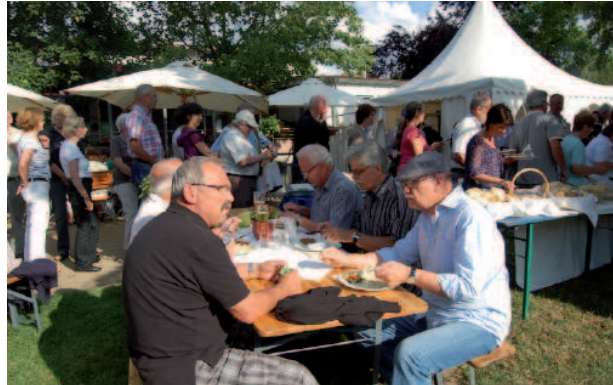
Sommerfest der Gießener Tafel

Ganz klar: Die Umbauarbeiten sowie der Umzug unserer Tafel in die neuen Räume war mit Abstand das wichtigste Ereignis im vergangenen Quartal. Doch auch um dieses herum ist im letzten Quartal wieder so Einiges rund um die Gießener Tafel passiert. So feierten wir am 8. Juli unser Sommerfest , welches in diesem Jahr – als Dankeschön für den tollen Zusammenhalt der Tafelmitarbeiter nach dem Brand – größer ausfiel. Man traf sich nachmittags im Ausbildungsrestaurant „Lahnterrasse“ der Zaug GmbH und verbrachte einen netten Abend gemeinsam (siehe Bild unten). Dass der Abend so gelungen ist, verdanken wir vor allem den Mitarbeitern von Zaug.