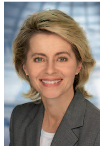
Bundesministerin für Arbeit und Soziales Ursula von der Leyen

Die SPD macht die Bundesministerin für Arbeit und Soziales, Ursula von der Leyen (siehe Bild rechts), für die Anlaufschwierigkeiten persönlich verantwortlich. Sie ist der Meinung, dass es besser gewesen sei, das Geld direkt in Kindertagesstätten, Schulen und Vereine zu investieren. Die Schwierigkeiten bei der Umsetzung des Paketes seien daher für die SPD nicht überraschend.