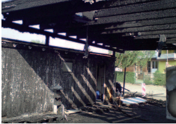
Ausgebrannte Container der Gießener Tafel

Feuer in der Tafel und ganz schnell die Entscheidung getroffen, weiter zu machen. Viele Tafelmitarbeiter/-innen haben sich in unermüdlicher Weise eingesetzt, geputzt, gereinigt, Hunderte von Kisten, die Kühlschränke und viel Zubehör mit Lappen und Hochdruckreiniger bearbeitet. Und alles, damit wir weiter arbeiten konnten und Menschen Hilfe erhalten.