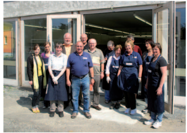
Ein Teil der vielen fleißigen Helfer bei der Eröffnung des neuen Tafelladens

Anfang August erfolgte der Umzug. Neue Abläufe galt es einzustudieren, es war warm (die Klimaanlage kommt noch), die Wege waren neu und bis heute sind wir am Überlegen und Probieren, welche Abläufe wir optimieren können, damit wir in der Sortierung und in der Ausgabe gemeinsam mit dem Fahrdienst gut und positiv zusammen arbeiten können.