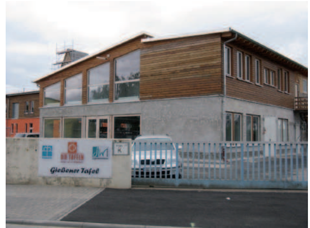
Das neue Gebäude der Gießener Tafel

Anfang August erfolgte der Umzug. Neue Abläufe galt es einzustudieren, es war warm (die Klimaanlage kommt noch), die Wege waren neu und bis heute sind wir am Überlegen und Probieren, welche Abläufe wir optimieren können, damit wir in der Sortierung und in der Ausgabe gemeinsam mit dem Fahrdienst gut und positiv zusammen arbeiten können.