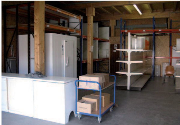
Übergangsräume in der Jugendwerkstatt

Eine Übergangszeit erfolgte in den Räumen der Jugendwerkstatt, eine Zeit, die nicht einfach war. Die Räume waren eng, man/frau hing aufeinander, Abläufe waren schwierig, die Kundinnen und Kunden sahen oftmals nicht mehr die Grenzen der Ausgabe - mit anderen Worten, es gab öfters Ärger.