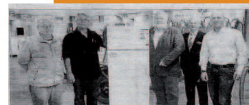
Neuer Kühlschrank für die Gießener Tafel Übergabe des neuen Kühlschranks von der Fa. Karstadt