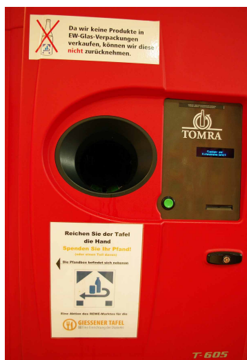
Pfandautomat bei REWE

Ausgehend von ihrer Zentrale in Rosbach startete nun auch REWE in Mittelhessen das Pilotprojekt „Flaschenpfand für die Tafeln“.