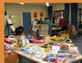
Die Mitarbeiterinnen beim Einpacken der Geschenke