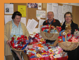
Kuscheltier-Spende der Frühchen-Gruppe Gießen