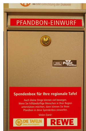
Pfandbox bei REWE

Der Vorteil der REWE-Flaschenpfandaktion ist, dass das Geld den ortsansässigen Tafeln direkt zugute kommt. Die Aktion von REWE soll später auf ganz Hessen ausgeweitet werden.