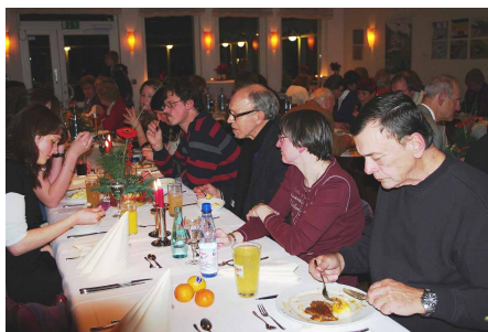
Tafel-Mitarbeiter und -Mitarbeiterinnen beim Essen

Das Diakonische Werk Gießen, als Träger unserer Tafel, hatte auch in diesem Jahr die ehrenamtlichen Mitarbeiterinnen und Mitarbeiter der Tafel zum „Dankeschön-Essen“ eingeladen. Es fand am 8. Dezember im Restaurant Lahnterrasse (Räume des Ski- und Kanu-Clubs Gießen) in festlichem Rahmen statt. Der Einladung gefolgt waren etwa 130 Tafelmitarbeiterinnen und -mitarbeiter aus den Bereichen Fahrdienst, Ladendienst und Sortierdienst.