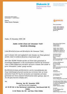
Einladung der Diakonie zum Dankeschön-Essen

Die Mitarbeiterinnen und Mitarbeiter bedankten sich mit einer Geldspende beim ausrichtenden Personal.